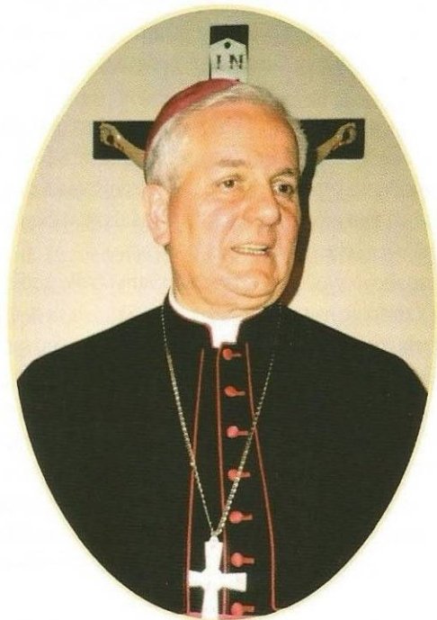
Mons. Franjo Komarica biskup banjolučki

B anjolučki je biskup mons. dr. Franjo Komarica rođen 3. veljače 1946. godine. Za svećenika je zaređen 29. lipnja 1972., a za biskupa posvećen u Rimu 6. siječnja 1986. Biskupijom upravlja od 15. srpnja 1989., kada je naslijedio umirovljenoga biskupa mons. Alfreda Pichlera. Trenutačno je i predsjednik Biskupske konferencije Bosne i Hercegovine. Na čelu Banjolučke biskupije našao se u teško vrijeme rata i protjerivanja Hrvata iz BiH, a posebice iz Banjolučke regije, tj. njegove biskupije. Nebrojeno puta dizao je glas u obranu obespravljenog čovjeka. Ovih je dana biskup Franjo Komarica predložen i prihvaćen za kandidata za Nobelovu nagradu za mir. Ponosni smo što nas je posjetio u Močilama na uskrсни ponedjeljak i počašćeni razgovorom koji objavljujemo u ovom broju Močila.